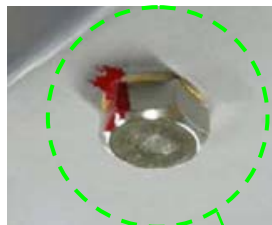
2011年～2013年頃製造品の気密栓例 (ボルトがケースと同色に塗装されたもの やカラーチェックの無いものもあります)