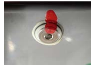
現在の気密栓 本お知らせの対象ではありません