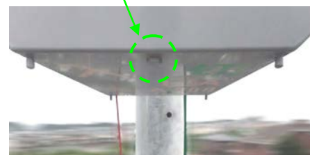
2011年～2013年頃製造品 (開閉器を指針側斜め下方から見た様子)