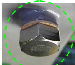
2004年～2011年頃製造品の気密栓例

※ 気密栓とは、工場における開閉器製造過程に於いて組み立てられた開閉器ケースに気密漏れが無い事を確認する際にケース内部を加圧する為にケース下部に設けられた気体注入口を、検査後に閉じるための栓です。